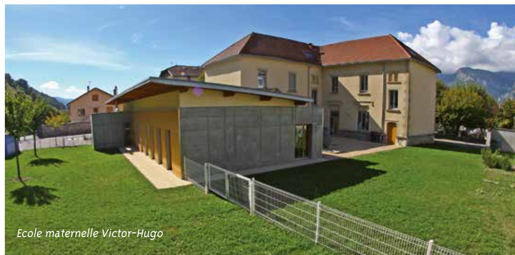
Ecole maternelle Victor-Hugo

Cette année scolaire sera marquée par le projet du nouveau restaurant scolaire de l'école République, l'objectif étant d'augmenter la capacité d'accueil afin d'assurer un service unique pour les enfants. La ville projette également la création d'une classe supplémentaire dans l'enceinte de l'école maternelle République. Villard-Bonnot travaillera sur un système de rafraîchissement des salles de classe pour les périodes estivales. Il sera aussi question de la mise en accessibilité des écoles au cours de cette année.