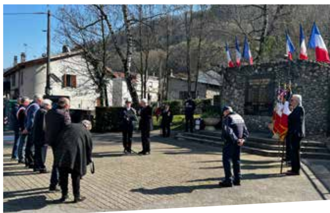
← Brignoud Villard-Bonnot →

Retour en images sur les cérémonies commémoratives du 19 mars, marquant la journée nationale du souvenir des victimes civiles et militaires de la guerre d'Algérie et des combats en Tunisie et au Maroc. À noter : à Villard-Bonnot, ce fut la première cérémonie célébrée sur la nouvelle place de l'Église ! ●